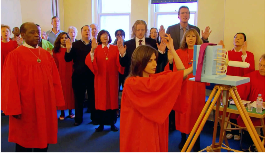
جلسة صلاة وشحن للبطارية (الصورة مأخوذة من مقطع يوتيوب).

إن المجتمع الأيثيري يتواجد في القرن الحادي والعشرين، ويقوم بمتابعة عقد اجتماعات عملية قوة الصلاة بشكل منتظم إلى جانب خدمات الشفاء الروحي. كما يتم إقامة الندوات والمحاضرات بشكل منتظم في مراكز المجتمع الأيثيري المختلفة. ويستمر الأعضاء في إيمانهم بأن التواصل مع كيانات ذكية من خارج الأرض سوف يتسبب باستحضار الإستنارة إلى سكان الأرض. يُقدّم الموقع الإلكتروني معلومات مُحدّثة عن مختلف النشاطات والندوات والخدمات والمنتجات التي يتم تقديمها.