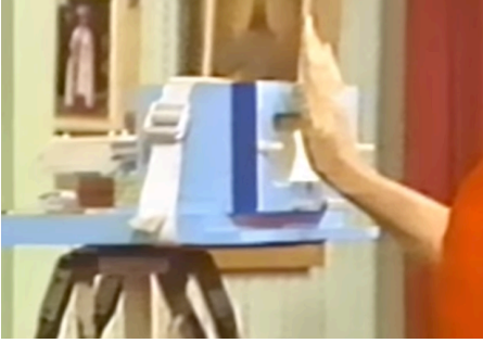
عملية شحن بطارية الصلاة

إن المجتمع الأيثيري منتظم حول مراكزه المختلفة. إن المركز الرئيسي الأمريكي متواجد في لوس انجيلوس في حين أن المركز الرئيسي الأوروبي متواجد في لندن. يوجد العديد من الفروع في كندا وأستراليا وأفريقيا وكذلك في نيوزلندا. يمكن للمرء أن يقوم بالتحصل على العضوية من خلال ملئ استمارة الكترونية متوفرة عبر